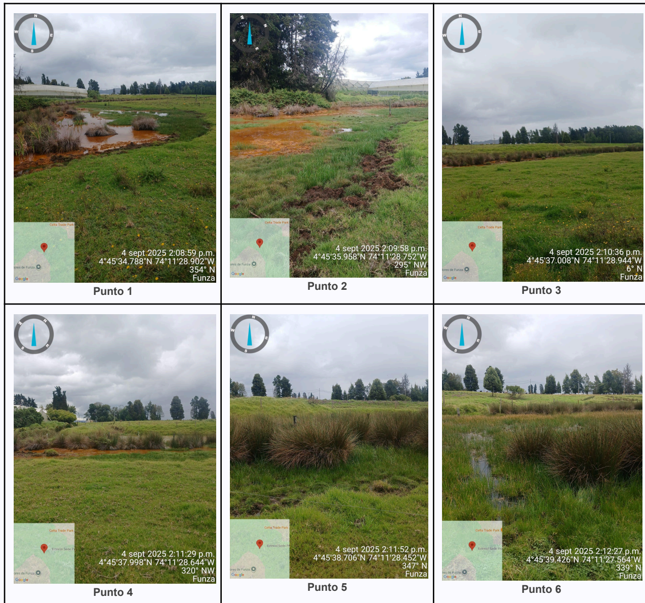
Ilustración 2. Fotos de los puntos del Recorrido de Control Y Vigilancia Ronda Del Humedal Gualí.